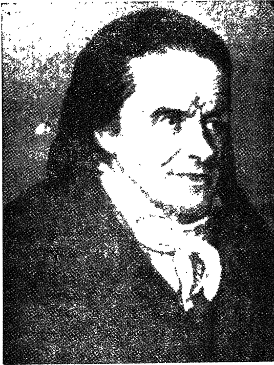
पेस्टालॉजी ( १७४६-१८२७ )